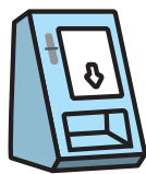
医療機関窓口のカードリーダー